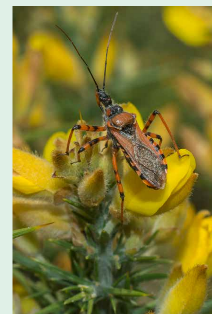
Percevejo-assassino | Assassin bug Rhynocoris cuspidatus Insecta / Hemiptera / Reduviidae

This bug spends winter as an adult. It feeds on seeds and sap of various plant species.