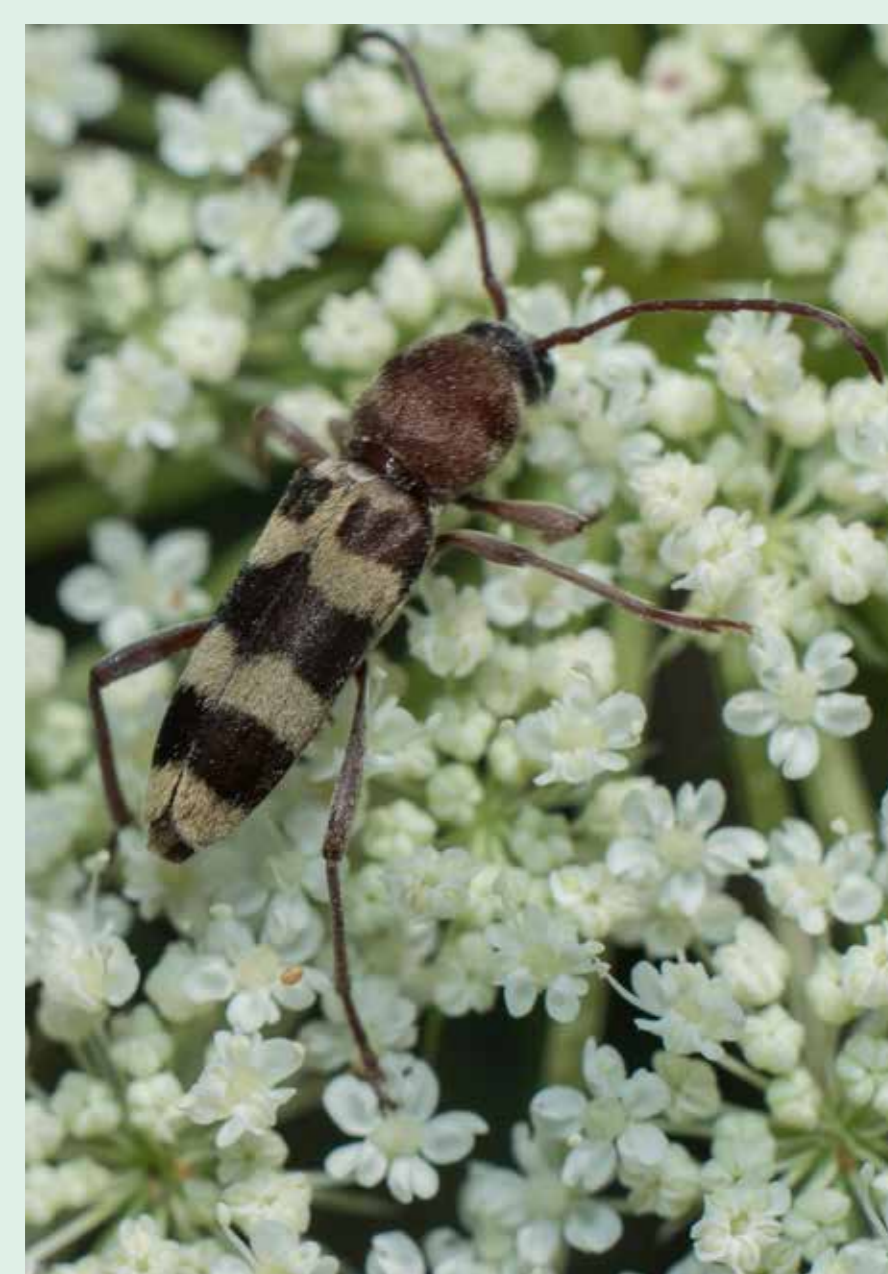
Escaravelho-longicórnio-das-3-faixas Longhorn beetle - Chlorophorus trifasciatus Insecta / Coleoptera / Cerambycidae

Olhe atentamente para as flores para observar e registar com fotografia diversos escaravelhos e percevejos Look closely at the flowers in order to find and photograph various beetle and bug species