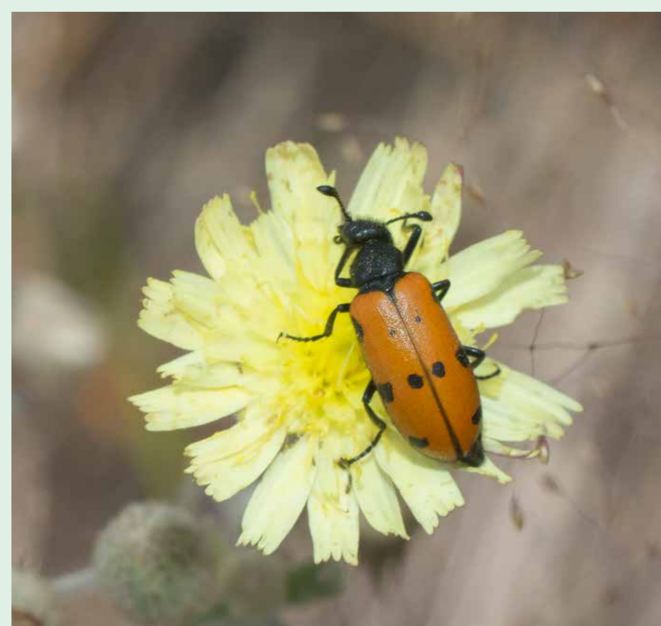
Escaravelho | Oil beetle - Mylabris sp. Insecta / Coleoptera / Meloidae

As suas larvas desenvolvem-se em plantas da família Fabaceae, como o codeço. Its larvae develop on plants of the Fabaceae (bean) family, such as Adenocarpus lainzii .