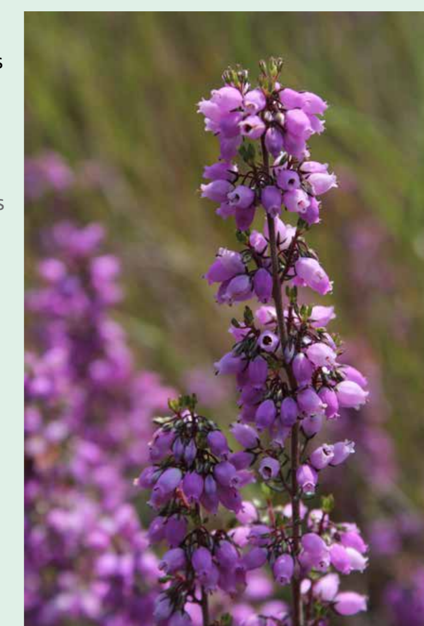
Queiró | Bell heather - Erica cinerea Eudicotiledonea / Ericaceae

Very branched and thorny bush, which can reach up to two meters in height. Its small leaves are accompanied by several hard spines.