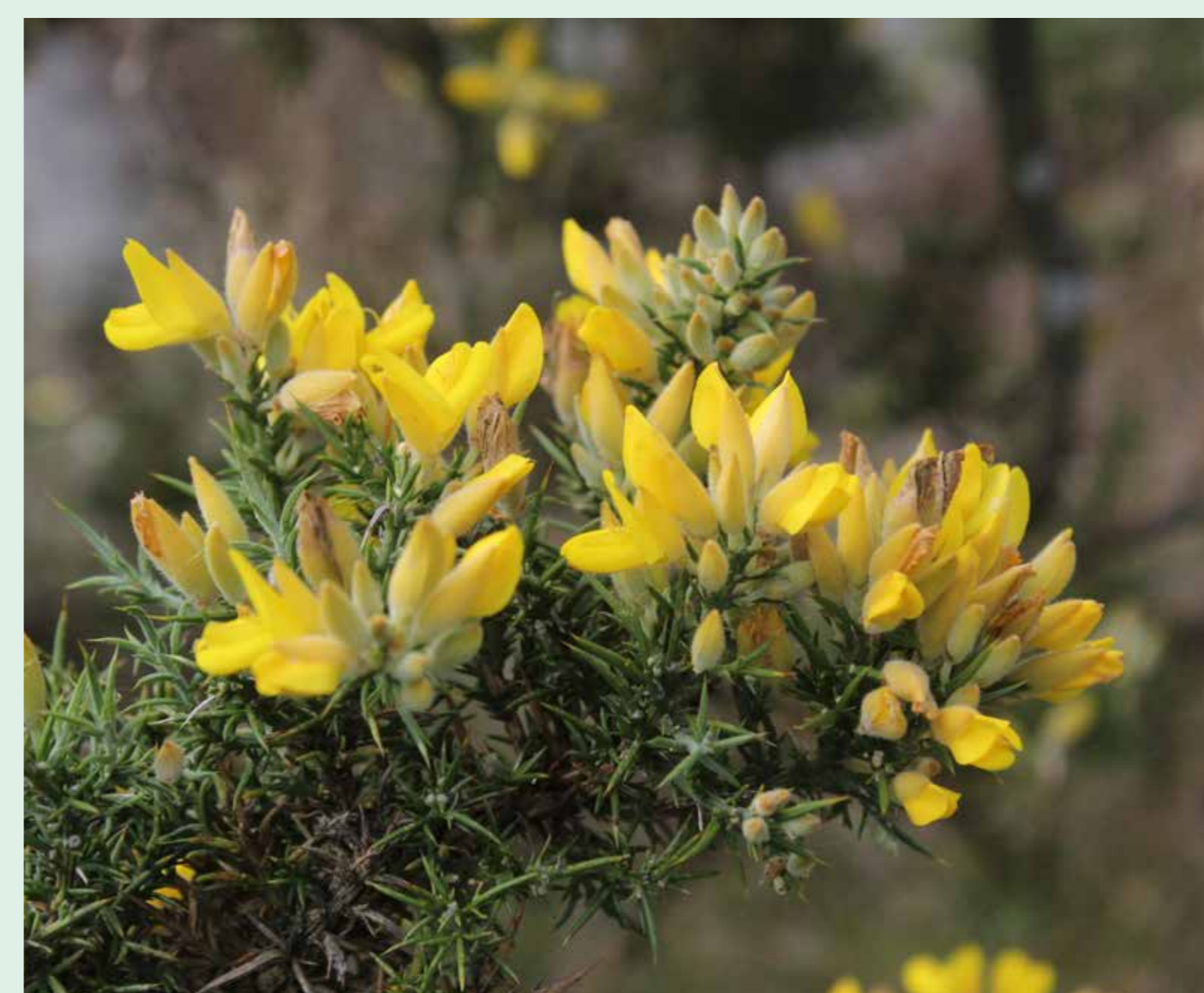
Tojo | Common gorse - Ulex europaeus Eudicotiledonea/Fabaceae

Flowers and fruit details. Endemic from the Iberian Peninsula, in Portugal this shrub inhabits mainly the northern coastal areas, enjoying the Atlantic influenced climate. It generally forms very dense populations, which occupy great areas, like what happens in Picoto.