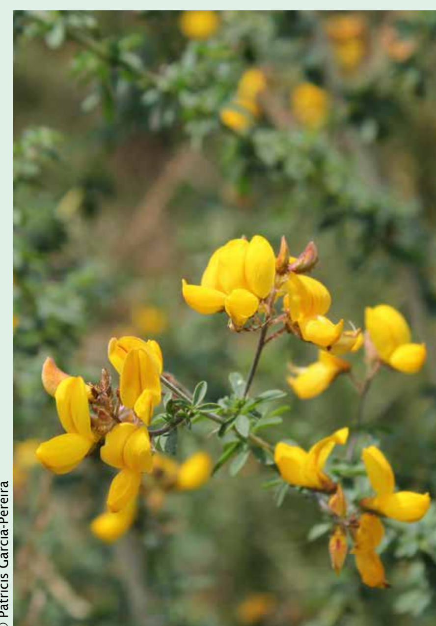
Codeço - Adenocarpus lainzii Eudicotiledonea / Fabaceae

Três arbustos abundantes que dão cor aos matos Three abundant shrubs that colour the landscape